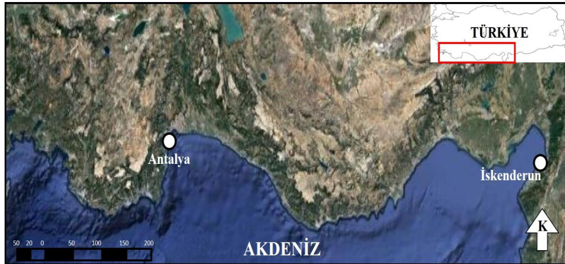
Şekil 1. Çalışma alanı. Figure 1. Study area.

Karides örnekleri kilitli plastik kaplar içerisinde buz ile direk temas ettirilmeden soğuk zincirde İskenderun Teknik Üniversitesi Deniz Bilimleri ve Teknolojisi Fakültesi laboratuvarına getirilmiştir. Laboratuvara getirilen bireylerin toplam boyları dijital kumpas yardımı ile telson ucundan rostruma kadar (TB) ölçülüp toplam ağırlıkları (TA) dijital terazi (0,01 g hassasiyet) yardımıyla tartılmıştır (Çizelge 1).