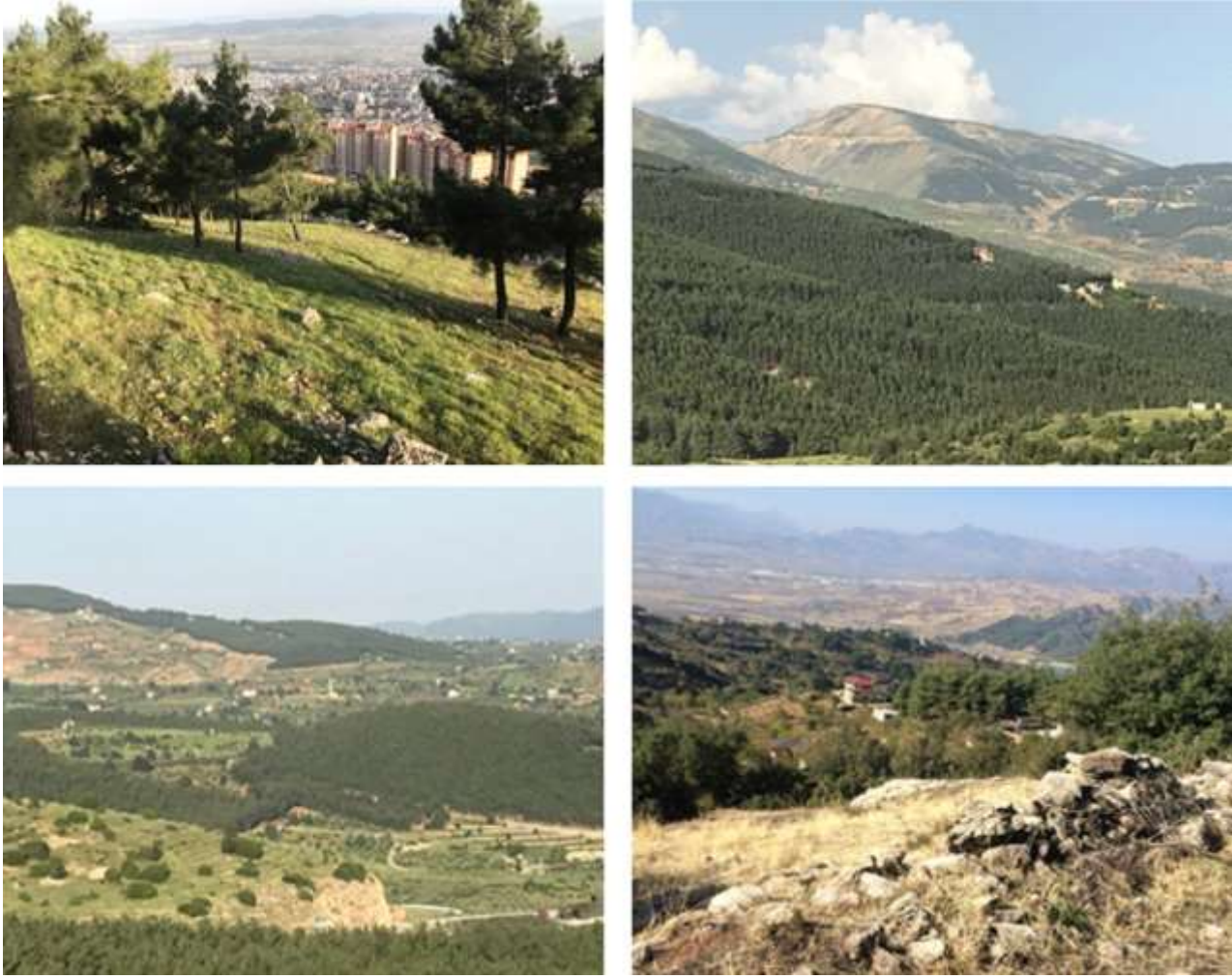
Şekil 2. Araştırma alanından bazı görünüşler